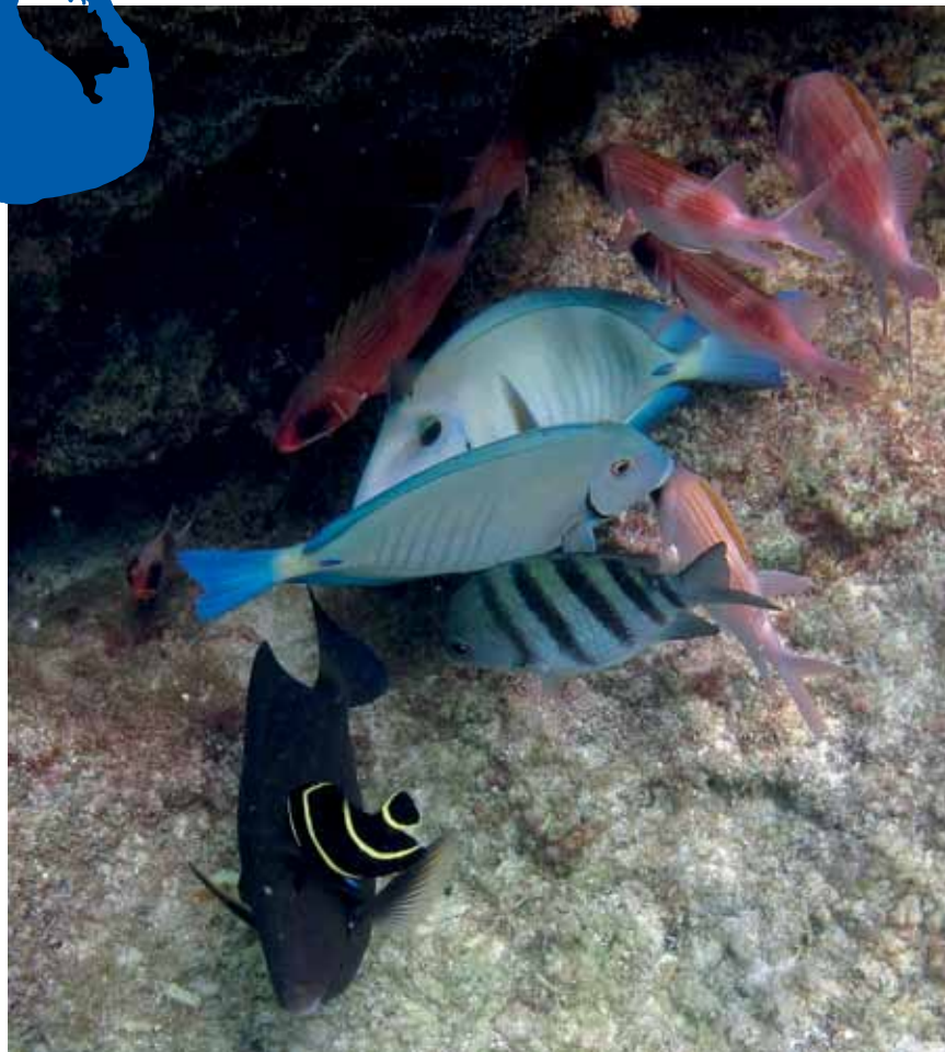
Pomacanthus paru (preto com listras amarelas) limpando Acanthurus

Dispersas pelas baías e ilhas do mundo, circulam 208 espécies de peixe-limpador, o equivalente a cerca de 3% das 6.500 espécies de peixe de recifes e menos de 1% do total das 30 mil espécies de peixe, de acordo com um levantamento coordenado por David Brendan Vaughan, da Universidade James Cook, da Austrália, publicado em 2016 na revista Fish and Fisheries . Camarões-limpadores são ainda mais raros. Das 51 espécies já identificadas, duas vivem no atol: Lysmata grabhami , com antenas brancas e até 6 cm de